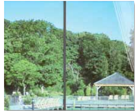
Prestige 70 Ulkokalvo