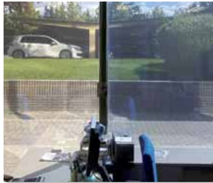
Prestige ulkokalvo verrattuna metalloituun hopeakalvoon

3M Ikkunakalvot on suunniteltu vähentämään auringon lämmön ja näkyvän valon vaikutuksia kalusteisiin ja sisustustekstiileihin. Ne estävät jopa 99,9% auringon haitallisista UV-säteistä, jotka ovat suurin yksittäinen haalistumisen syy.